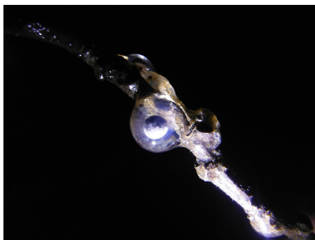
FIGURA 3. Puesta de huevos de Ambystoma velasci colocados en la vegetación circundante de las pozas de agua.

En cuanto a la dieta de Ambystoma velasci , se ha registrado que consume ninfas de odonatos (libélulas), peces y a otros ajolotes; es decir, que hay canibalismo en la especie (Leyte-