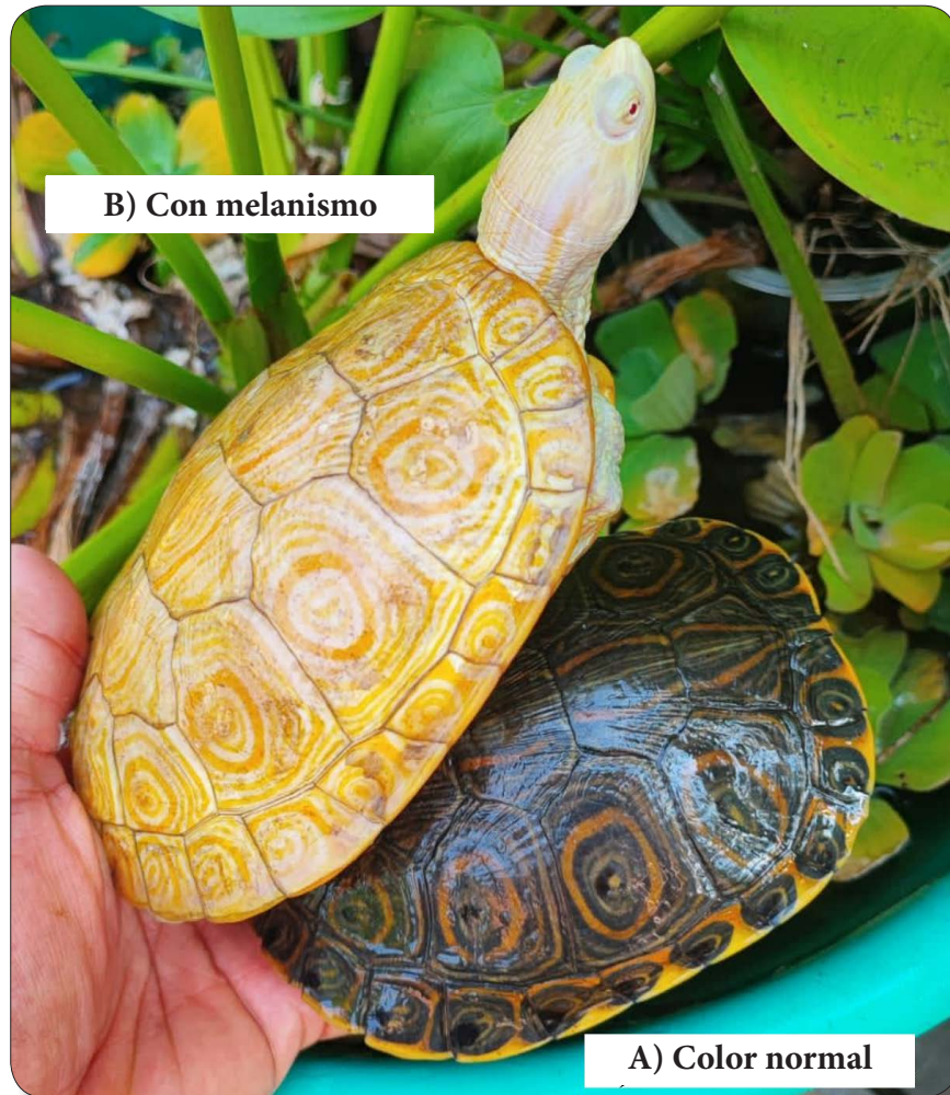
Figura 1. Trachemys venusta . Ejemplares adultos en cautiverio de coloración normal o típica (A) y con amelanismo (B). Tomada de Rosales-Martínez et al. (2023).

Sin embargo, en ocasiones sucede que la pigmentación de la piel, escamas, caparazón u ojos de ciertos ejemplares de T. venusta , cambia notoriamente su coloración típica o esperada descrita líneas arriba en un fenómeno llamado coloración aberrante o anormal (Bechtel, 1995; Borteiro et al., 2021). Al respecto, se ha establecido que estos patrones inusuales de color resultan de